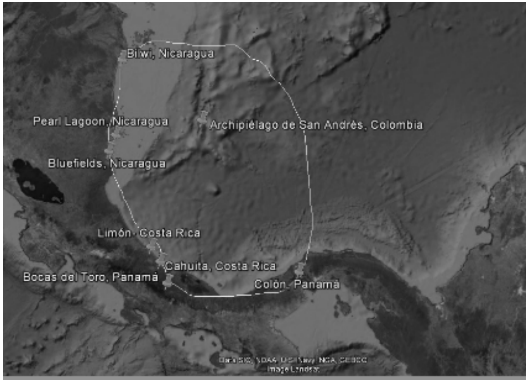
Figura 1: Delimitación de la zona fronteriza a partir de las poblaciones colindantes entre Colombia, Panamá, Costa Rica y Nicaragua en el Caribe