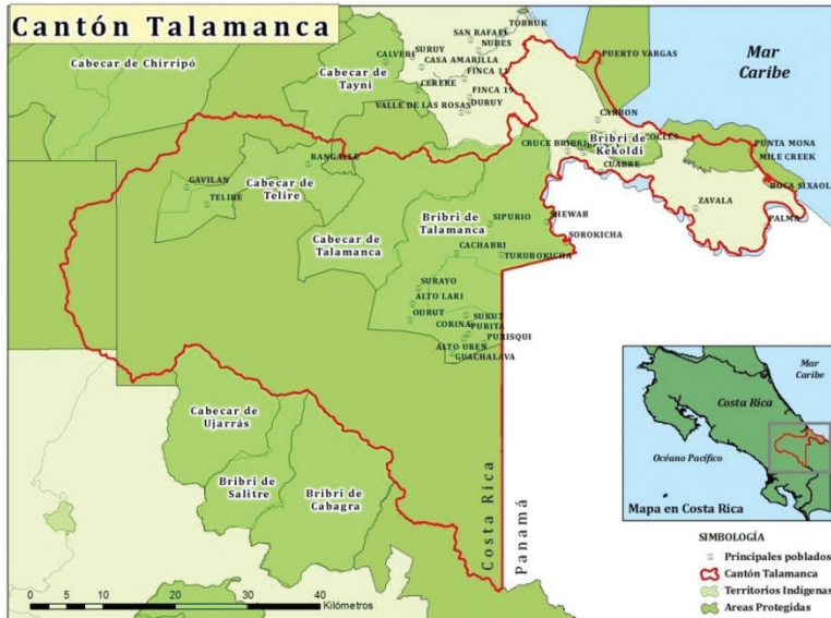
Figura 3 DELIMITACIÓN DE ÁREAS PROTEGIDAS Y TERRITORIOS INDÍGENAS EN TALAMANCA