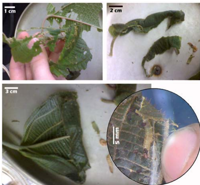
Figura 1. Fotografías con estereomicroscopio de larva de Lepidoptera no identificada recolectada en Conostegia subcrustulata (Melastomataceae), herbivoría y enrollamiento de hojas. Finca Las Juntas, Cariari Limón 7 V 2008

En el primero de los casos, adicional a la herbivoría sobre esta Melastomataceae, las larvas ocasionaron un enrollamiento de las hojas durante su etapa de pupación, ambos, aspectos relevantes en términos de control biológico (Figura 1). Debido al hábito taladrador de semillas de la larva hallada en S. ulmifolia (Figura 2) se afectaría la viabilidad y dispersión de las mismas, que conlleva a una reducción del banco respectivo y se establecería un control de esta planta en el tiempo. Dichas especies de plantas arvenses son comunes en pastos y suelen asociarse al ecosistema bananero donde generan impacto económico por su difícil manejo.